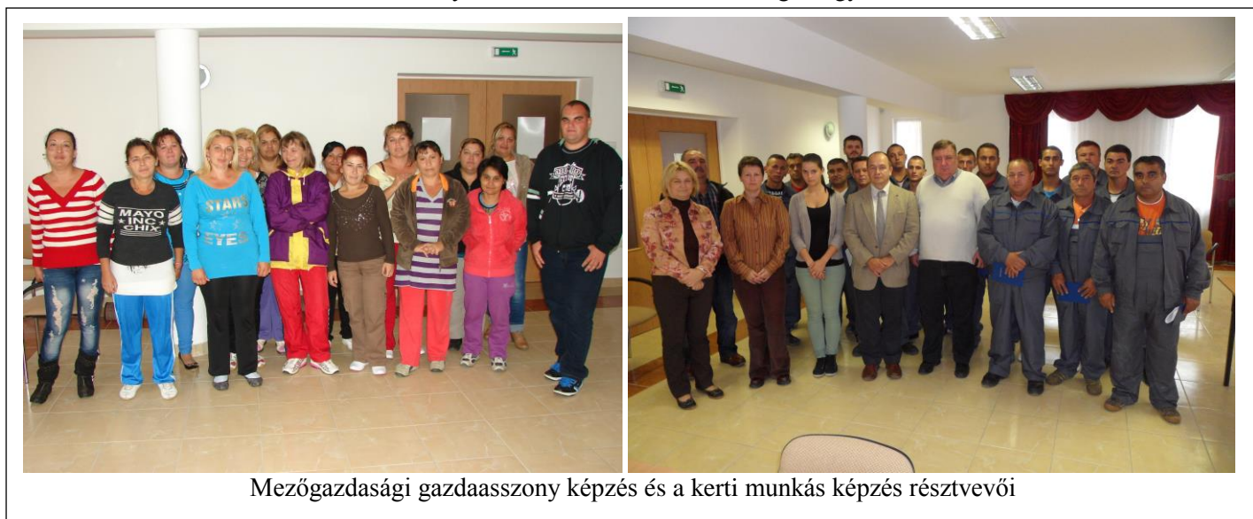
Mezőgazdasági gazdaasszony képzés és a kerti munkás képzés résztvevői

A gyakorlati oktatás pedig az alábbiak szerint alakult: Két szántóföldi kultúra, a kukorica és a burgonya növényápolási munkái. Zöldségnövények ápolási munkái (pl.: uborka, karalábé, káposzta). Talaj előkészítési és tápanyag-utánpótlási munkálatok. Facsemeték ültetése. Növény felismerési feladatok, vetőmag- és gyomismeret. Betakarítási munkák.