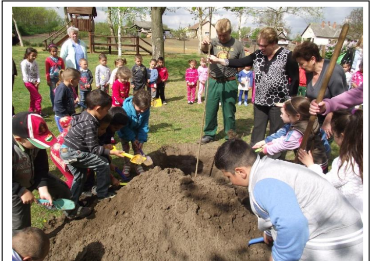
Kisfa ültetés Madarak és fák napján az óvoda udvarán

beépítettük a programjainkba, tehetséggondozó csoportot is működtettünk, és hittan órákra is jártak néhányan. Az egyéni fejlesztő munkát az óvónőkön kívül logopédus. és fejlesztő pedagógus segítette, akik a Pedagógiai Szakszolgálattal jártak heti rendszerességgel. Jelentősen bővült az udvari játékparkunk a Demján Sándor Értetek Karitatív Egyesület alapítványának köszönhetően. Támogatást kaptunk az „Encsenci iskoláért alapítványtól” is, akik a gyermekek és szüleik kirándulását tették feledhetetlenné a nyíregyházi Vadas parkban. Pályáztunk az integrációs pedagógiai rendszer támogatására, melynek keretében a gyermekek szociális helyzetén tudtunk segíteni és óvodai bútoraink, elsősorban székek, asztalok, játszószőnyegek, kanapék kerültek beszerzésre. Mint látható nem volt hiába való tevékenységünk, melyet a jövőben is hasonló módon kívánunk folytatni. Maximálisan biztosítva egy olyan légkört, ahol gyermekek, szülők, dolgozók és a hozzánk betérő kedves vendégek is jól érezhessék magukat. Tanévünket az óvodai ballagó és évváró ünnepély zárta, amelyen a búcsúzó gyermekek és a tehetséggondozó csoport színvonalas műsora tett széppé. Az előttünk álló tanév a közel 90 gyermekkel, az új óvónőkkel reméljük ismét mindenki számára megelégedést fog hozni.