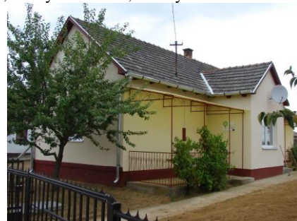
Csillagpont – Arany János u. 6.

Kossuth utca és a Bem köz egyik része, Damjanich utca, Arany János utca, Károlyi utca