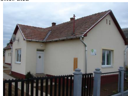
Csillagpont – Dobó u. 47.

Sport és Dobó utca egyik része, Vörösmarty utca, Tancsics utca