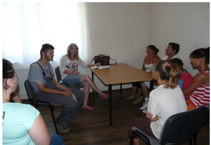
Játék a Baba-Mama Klubban / „Egészségre” Klub a házi orvossal