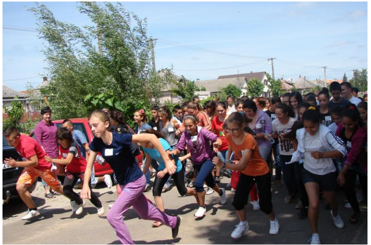
Önkéntesek az erdei szemétszedésben / „Fut a falu” futóverseny rajtja